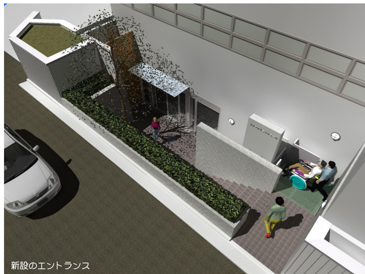
新設のエントランス