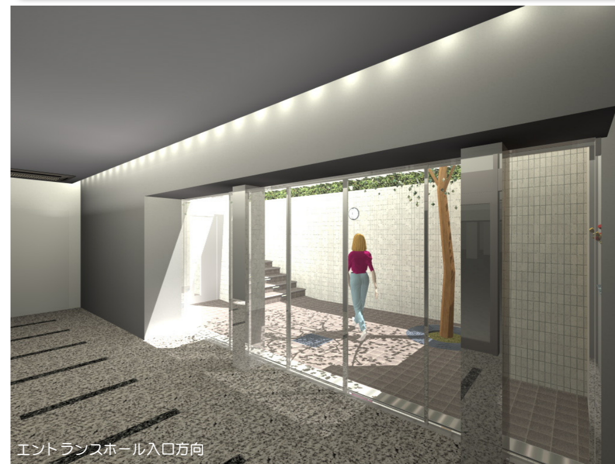
エントランスホール入口方向