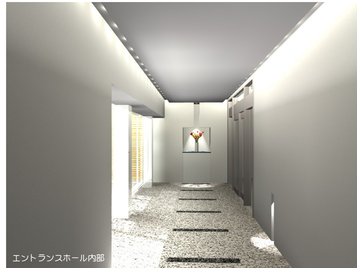
エントランスホール内部